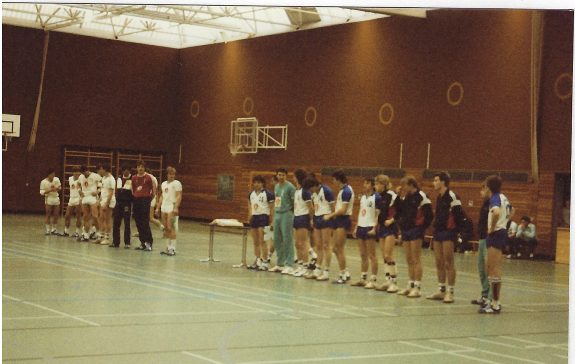
Begrüßung der Mannschaften. Kampfgericht und Wechselzonen befanden sich damals noch gegenüber der Tribüne.